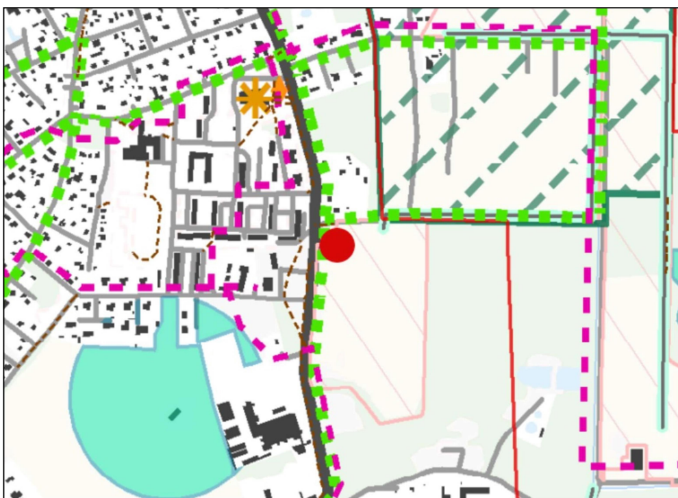
Skeem 2. Väljavõte Raasiku valla üldplaneeringu väärtuste ja piirangute kaardist.