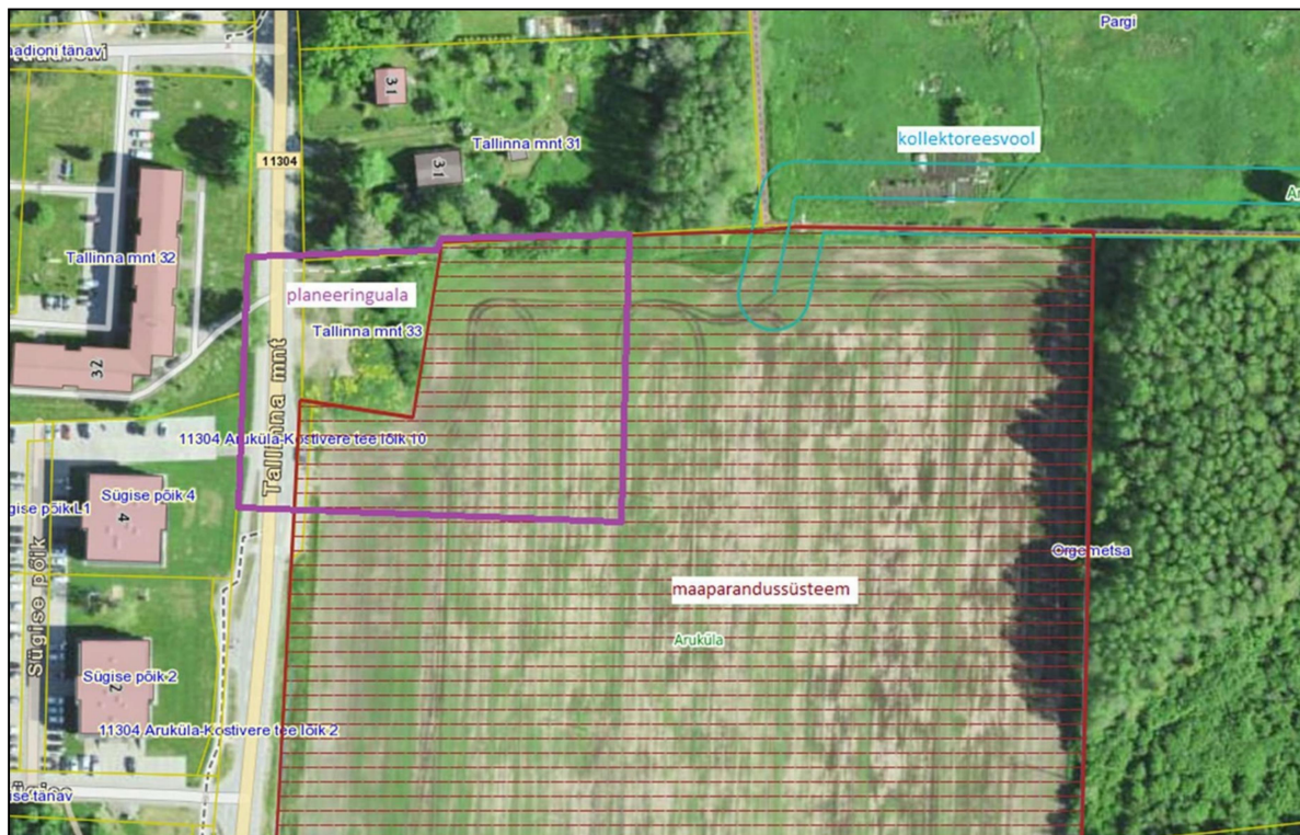
Skeem 3. Väljavõte maaparandussüsteemide andmete kohta Maa-ameti geoportaalist.

Planeeringuala põhjapiiril tuleb säilitada kraav, mis suubub Aruküla peakraavi.